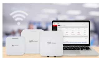
Sicheres, cloud-verwaltetes WLAN