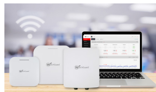
Sicheres, cloud-verwaltetes WLAN